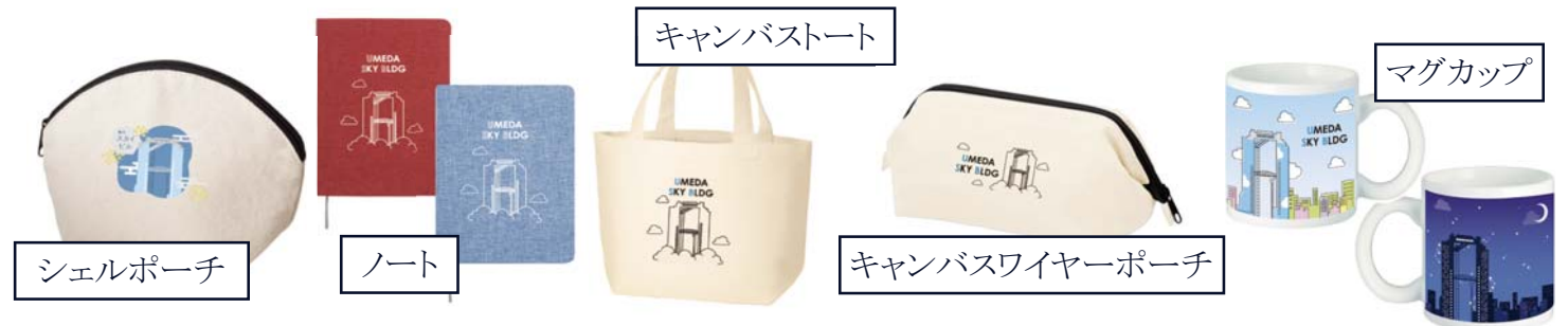
キャンバストート