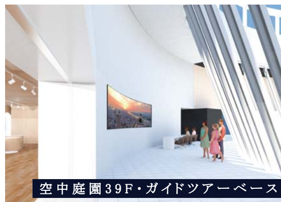
空中庭園39F・ガイドツアーベース

開業から25年の歴史を持つ梅田スカイビルには、これまでは入ることのできなかつた場所や魅力が数多く存在しています。このツアーでは、梅田スカイビルのまめ知識紹介と共に普段は入ることのできない場所も巡り、様々な角度からビルの魅力に迫ります。旅の思い出に・子どもたちの学校教育に・企業視察に、見学の目的に合わせてアテンドが丁寧にご案内します。